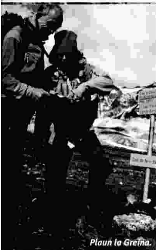
Plaun la Greina.